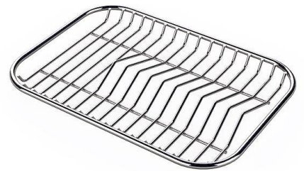
Tellerständer aus Edelstahl nur mit Zubehör 8644 003 verwendbar 8100 154 * nur in Kombination mit dem Zubehör 8644 003