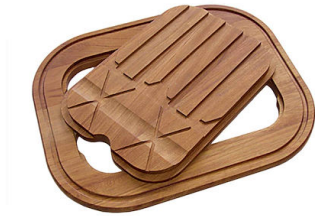
Schneidebrett Twin aus Iroko-Holz 8644 003