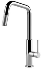
Mischbatterie KS Plus 8522 000