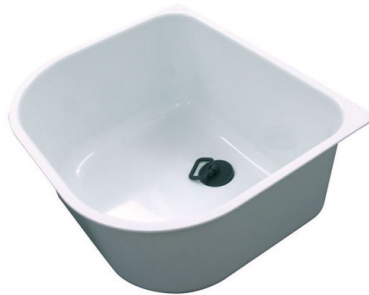
Weißes Wanne 8152 100 * nur in Kombination mit dem Zubehör 8100 112